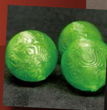
素材を変えれば色付き加工も可能