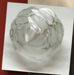
フィラメントのピッチの変化が光を変化させます