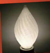
和紙のような風合い