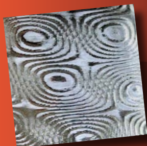
数学的曲線のデザインと0.5mm以下の精度により実現したモアレ縞模様